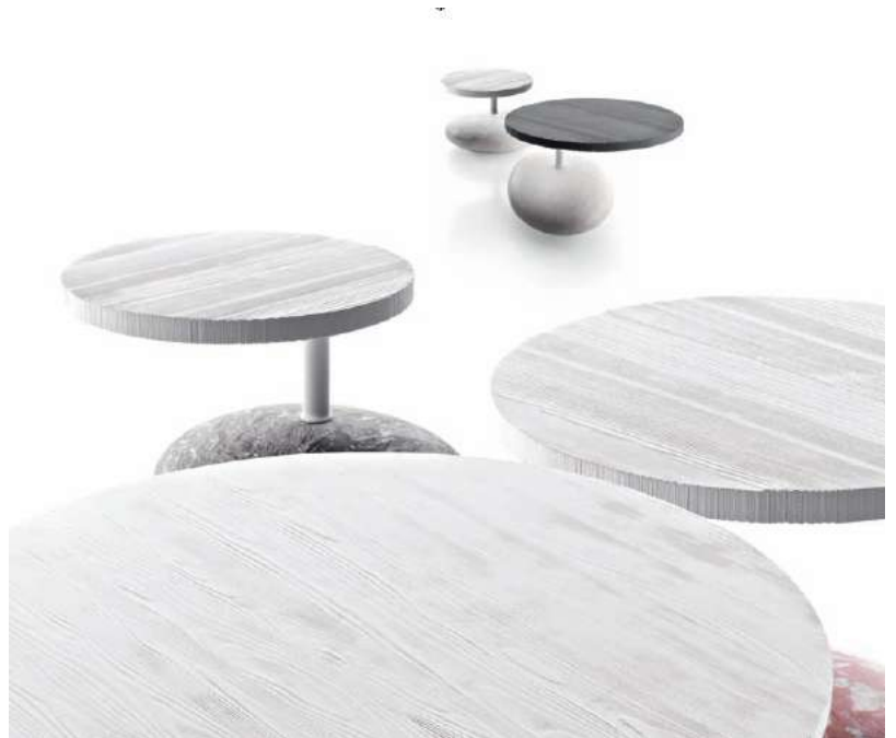
COFFEE TABLE PAVE' DRINK